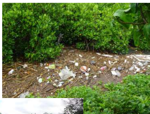
国場川河岸のごみ