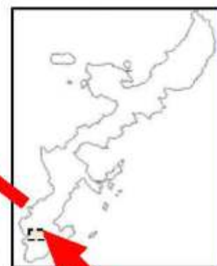
③大度浜海岸 (糸満市)